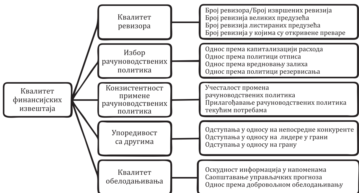
Слика 1 - Детерминанте квалитета финансијских извештаја

На овом месту нећемо се упуштати у детаљнија образложења појединих елемената датих у оквиру приказа. Сматрамо да су дати параметри на слици са десне стране довољни да упуте на